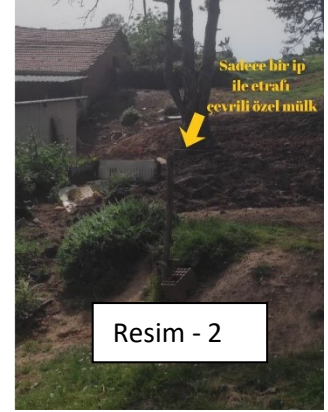
Resim - 2

- Harita ISOM 2017-2 standartlarına göre çizilmiştir.