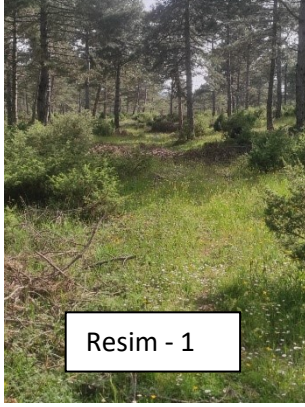
Resim - 1

Kirazören Mahallesi Haritası ile ilgili uyarılar.